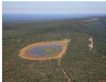
La Laguna Letie