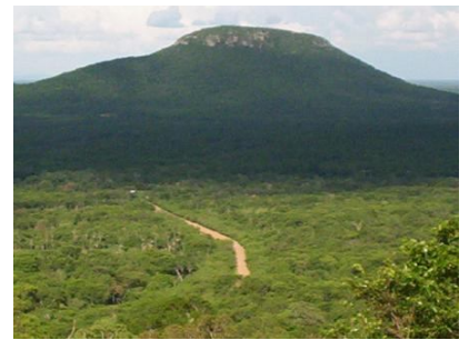
El Cerro de Turubó