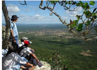
Vista del Cerro Turubó