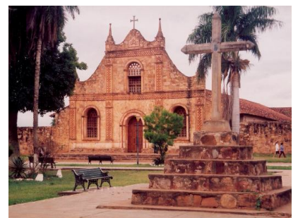
Complejo Misional Jesuítico