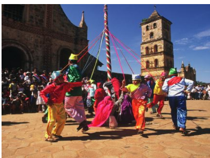
Fiesta “Día de La Tradición”