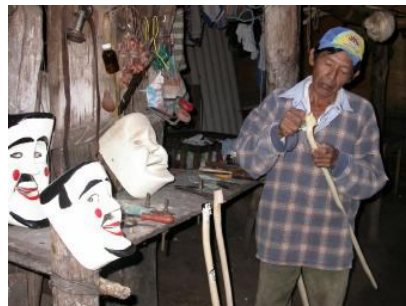
Artesanías en el Barrio artesanal