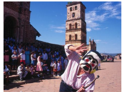
Fiesta “Día de La Tradición”