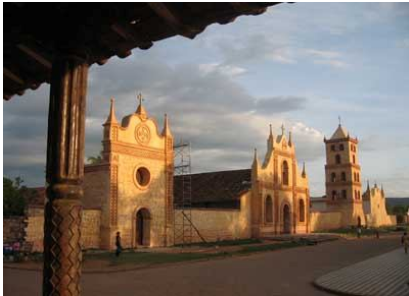
Complejo Misional Jesuítico