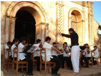
La Orquesta Juvenil