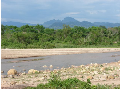
Río Saguayo & The Amboró