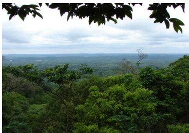
View from above the Amboró