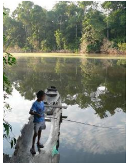
Fishing in the jungle lagoon