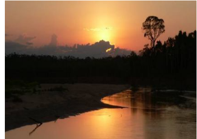
Sunset at Río Isiboro