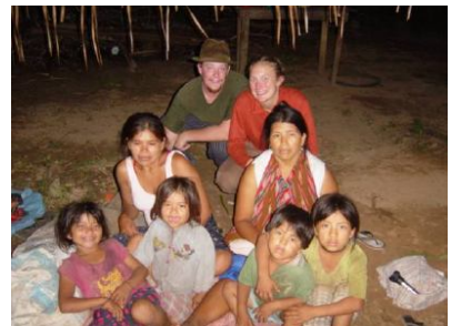
Sharing experiences with the local people