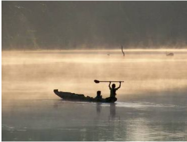
Mysterious atmosphere by sunrise at the lagoon