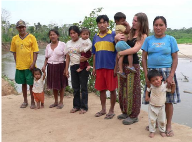
Welcome to San Benito