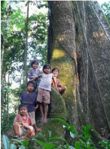
Kids in front of a Mapajo Tree