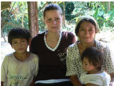
Indigenous host family