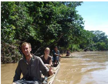
Excursion by canoe