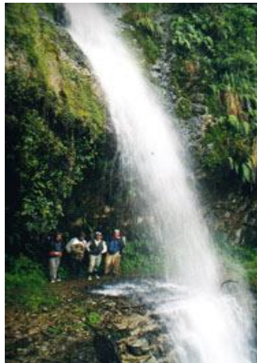
Cascades above the road