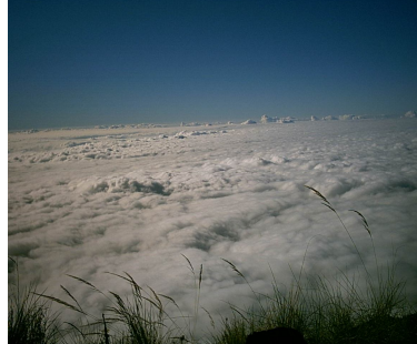
Above the clouds