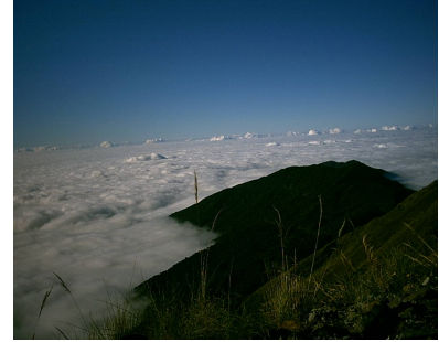
Clouds covering the Amazon Basin