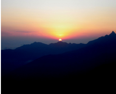
Sunrise in the mountains